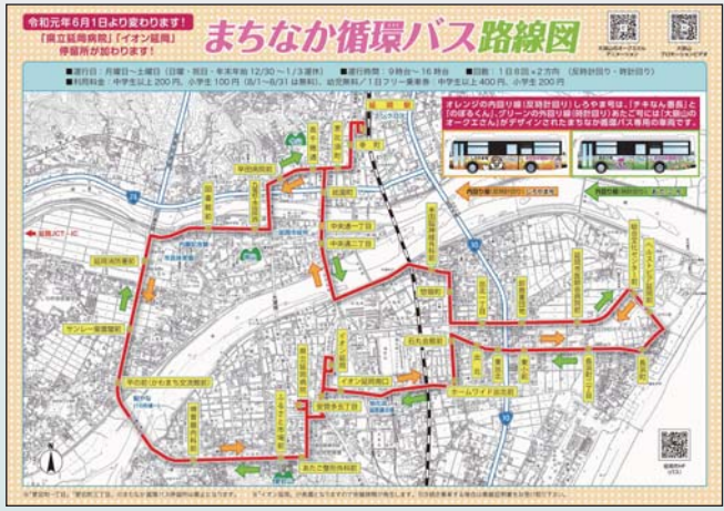
(令和元年6月1日改正)