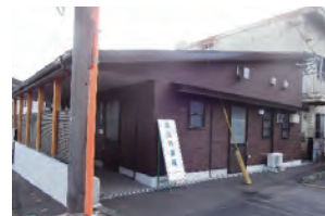
新設された発熱外来棟