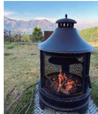
グランピングの焚火