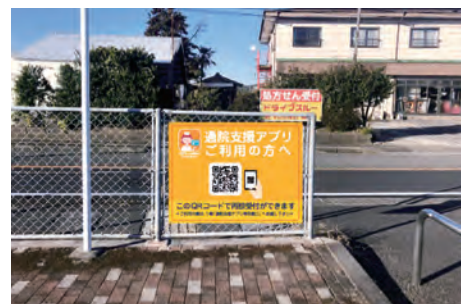
(図②写真はイメージです)

そのまま、車内など、当院敷地内でお待ちください。順番が近づいたら、アプリでお知らせするので、診療科へお越し下さい。