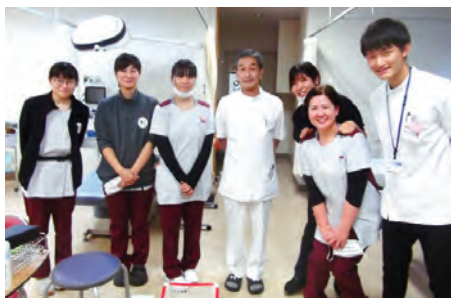
東院長(中央)、研修医、看護師と共に