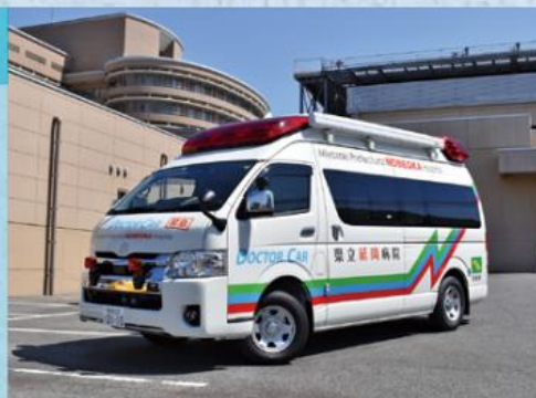
救急車型ドクターカー

平成25年にヘリポートを備えた救命救急センターが開設し、令和3年に宮崎県内初の救急車型ドクターカーを導入するなど、県北医療圏の救命率向上に向けて機能強化を図っています。