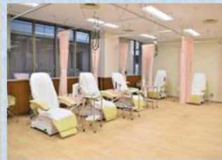
化学療法センターチェア