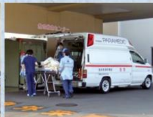
救命救急センター