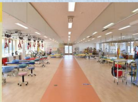
リハビリテーションセンター

急性期病院のリハビリテーションセンターとしてチーム一丸となって、「患者さんの声に耳を傾け」「思いに寄り添い」患者さんの機能回復に重要な「早期離床」を目指します。