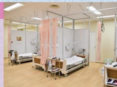
化学療法センターベッド

また、センター内にはご家族待合室、相談室、オストメイト対応トイレ、薬剤調剤室を設けたことで利便性が大きく向上し、これまで以上にスムーズな治療ができるようになりました。