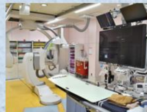
心臓カテーテル室