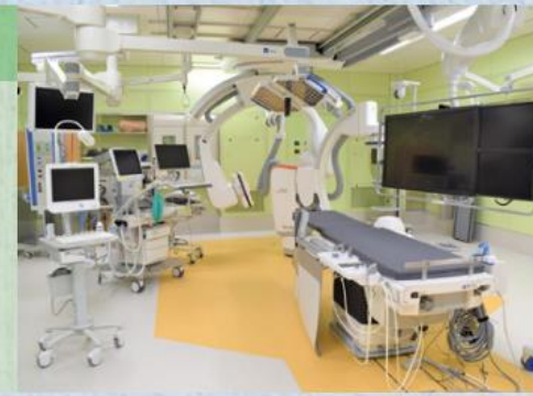
ハイブリッド手術室

そして令和6年、県北地域初となる「ハイブリッド手術室」を、当センターの第3室として新たに開設しました。心疾患に加えて脳卒中や重症外傷など一刻を争う救急疾患に対して、より迅速かつ精密な治療をおこなうことが可能となります。