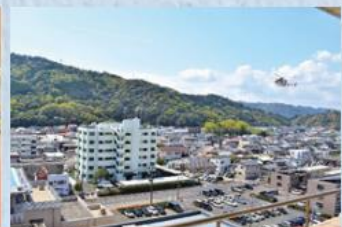
リハビリテーションセンターから臨む風景