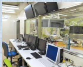
ハイブリッド手術室操作室