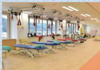
リハビリテーションセンター内部